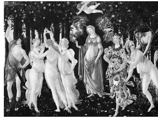
Botticelli - La primavera