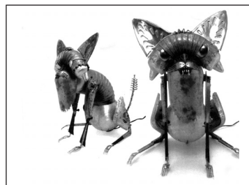
Fabius Tita - Gatto Gremlin 2002

scultore gli aggiunge alle sue tradizionali sette vite un'ottava fatta di posaterie varie, piastre di ferri da stiro, avanzi di stufe, cavi e spie luminose.