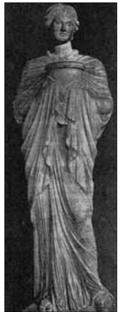
Pandora - Scultura antica

originario. Una summa del pensiero cristiano che, iniziando con la formazione del cielo e della terra , la separazione della luce dalle tenebre , la creazione degli astri , la creazione di Adamo e poi di Eva , il peccato originale , il diluvio universale , in un viaggio a ritroso nel tempo, ritrova dall'antichità i profeti e le sibille delle lunette, come prefigurazione del divino cristiano e, tra essi, disposti su plinti gli ignudi , i pagani che volgono le spalle al cielo perché non ebbero la ventura di conoscere il mondo sub gratia .