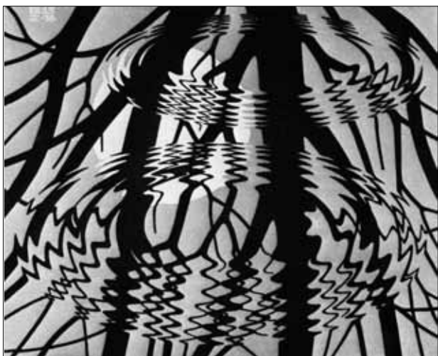
Escher. 1950 - Superficie increspata