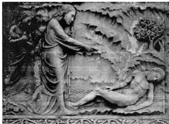
L. Maitani, La creazione dell'uomo , 1320 ca, Orvieto

A differenza della teogonia le origini dell'umanità restano avvolte in un cono d'ombra. In quell'affascinante invenzione poetico filosofica che è il mito di Prometeo, si narra che fu Prometeo, figlio di Giapeto e dell'oceanina