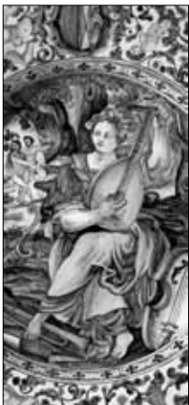
Piatto da pompa (part.) - maiolica sec. XVII - Castelli