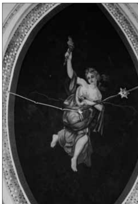
Casa De Pompeis - Decorazione

storiche, Torre dei Passeri, nel 1652, diveniva possesso dei Marchesi Mazara di Sulmona, col favore di quei viceré spagnoli che agevolavano la